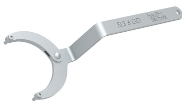
Klucz do pokryw