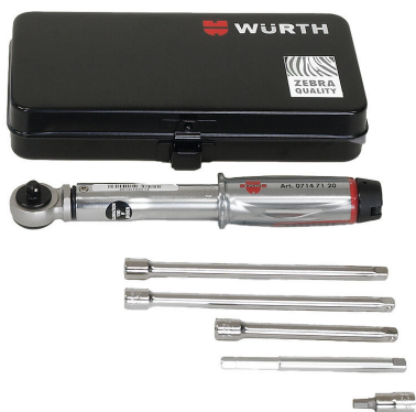
Zestaw narzędzi do montażu pokryw HSI150 DG/HRK SSG