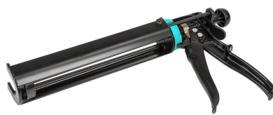
Pistolet na wkłady