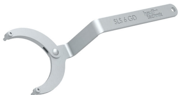
Klucz do pokryw